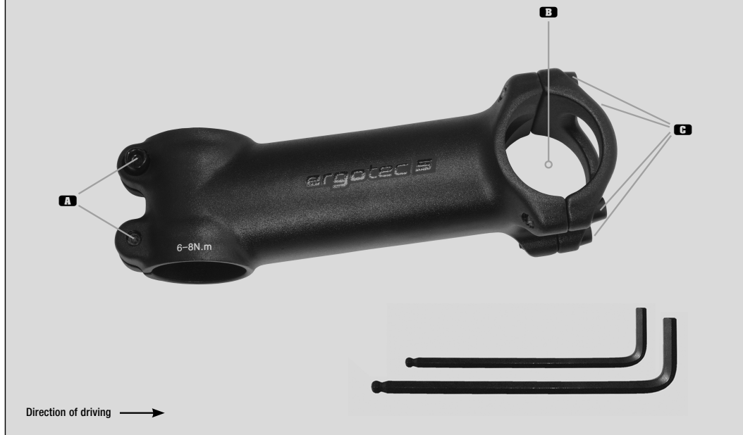
Ahead stem SHARK

! For safety reasons the max. tightness value of 8 Nm must not be exceeded.