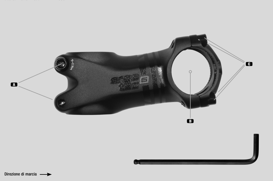
Tubo cannotto Ahead PIRANHA 650 B

⚠ Per motivi di sicurezza la coppia di serraggio max. non deve superare i 8 Nm.