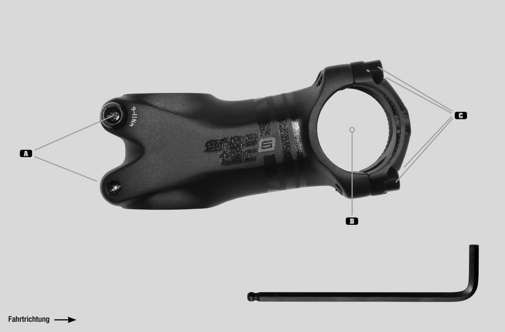
Ahead-Vorbau PIRANHA 650 B

⚠ Um einen Sturz oder Unfall zu vermeiden, muss der Vorbau nach einer Beschädigung unbedingt ausgetauscht werden.