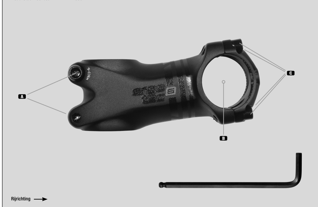
Ahead-stuurvoorbouw PIRANHA 650 B

! Om veiligheidsredenen mag het max. aandraaimoment van 8 Nm niet worden overschreden.